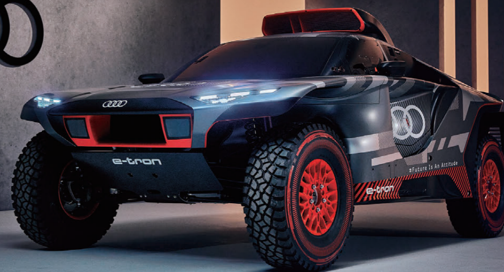
Audi RS Q e-tron